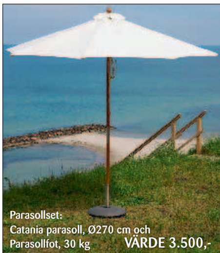
Parasollset: Catania parasoll, Ø270 cm och Parasollfot, 30 kg VÄRDE 3.500,-